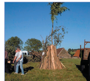
Feu de Saint Jean