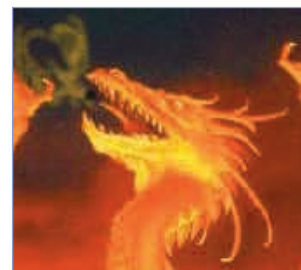
Mondes et Dragons

fêtes. Nous remercions nos partenaires qui nous permettent d'éditer ce bulletin.