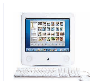
Internet pour tous...