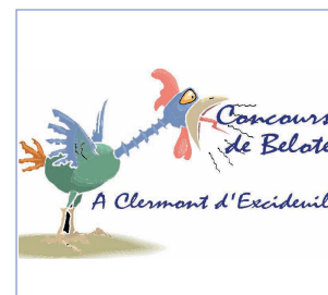
Concours de belote

Le comité des fêtes est heureux de vous présenter son premier bulletin, il sera suivi nous l'espérons de nombreux autres. Sa parution est prévue tous les six mois, un semestriel donc, de huit pages. Vous y trouverez toutes les activités passées et futures du comité des