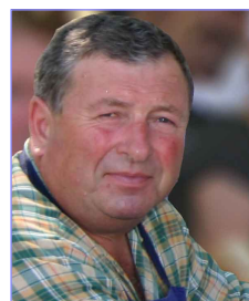
Repas du village...