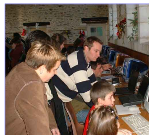
Internet pour tous...