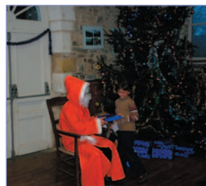
Noël des enfants