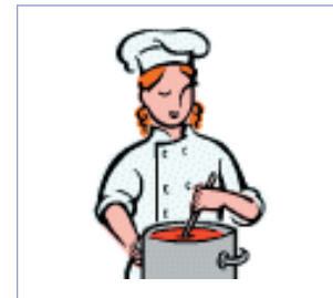
Recette de cuisine