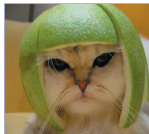
Concours de photos...